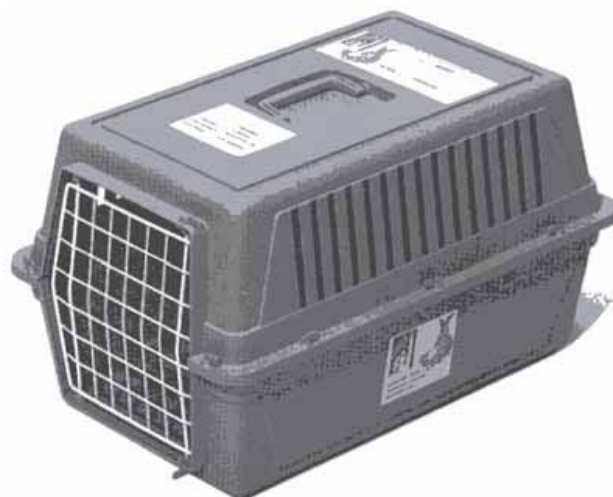
Katzen- Transportbox (für Kaninchen geeignet; erhältlich in Zoofachgeschäften)