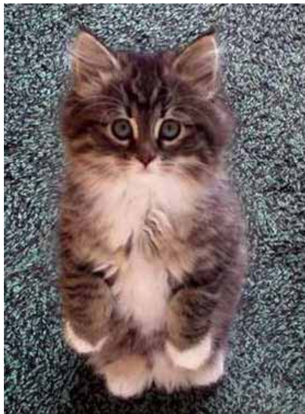
... Katzen sind von der Beförderung auf dem Postweg ausgeschlossen!