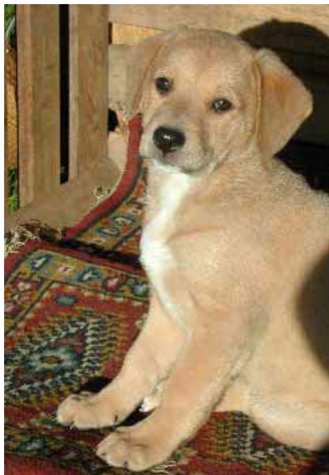
Ohne Ausnahme: Hunde und ...